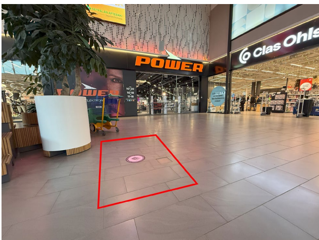
Promo 7. Sepän paja b, koko 5 x 3m