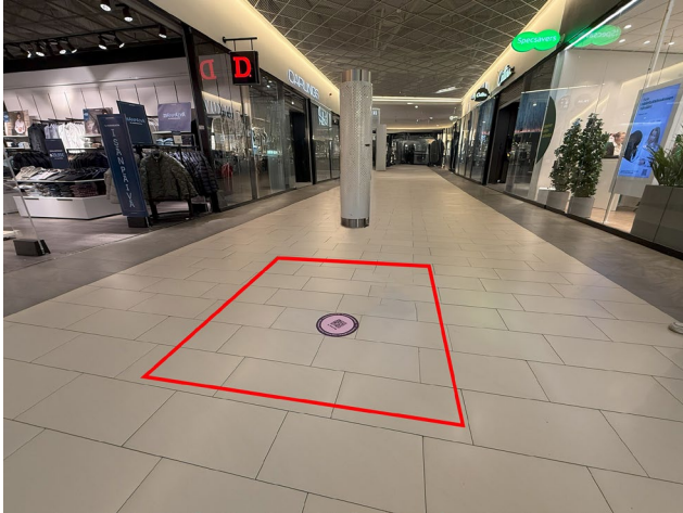
Promo 5. Alasinkuja b, koko 4 x 1,5m