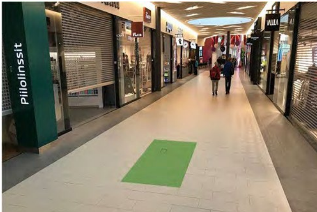
Promo 5. Alasinkuja b, koko 4 x 1,5m