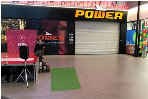
Promo 7. Sepän paja b, koko 5 x 3m