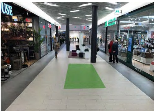
Promo 3. Vasarakuja, koko 4 x 1,5m, ei sähköä