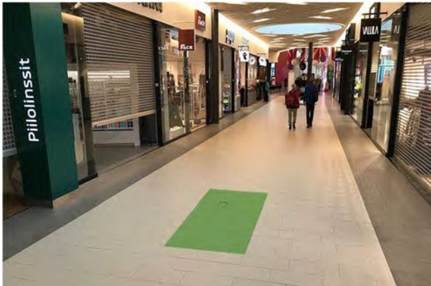
Promo 5. Alasinkuja b, koko 4 x 1,5m