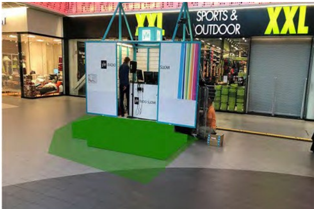
Promo 6. Sepän paja, koko 5 x 3m