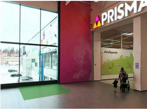
Promo 1. Prisma sisääntulo, koko 5 x 2m