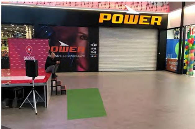
Promo 7. Sepän paja b, koko 5 x 3m