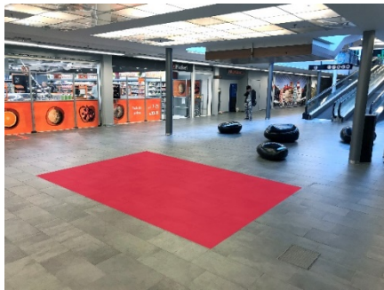
Paikka 1. 0. Kerros Sähköt on