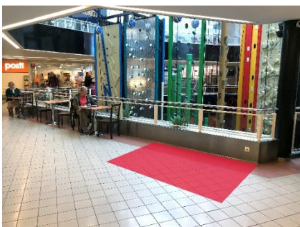
Paikka 4. 1. Kerros Sähköt on