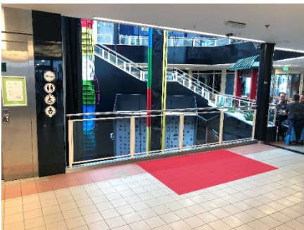
Paikka 3. 1. Kerros Sähköt on