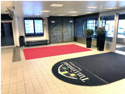
Paikka 2. 1. Kerros Sähköt on (pääovien vieressä)