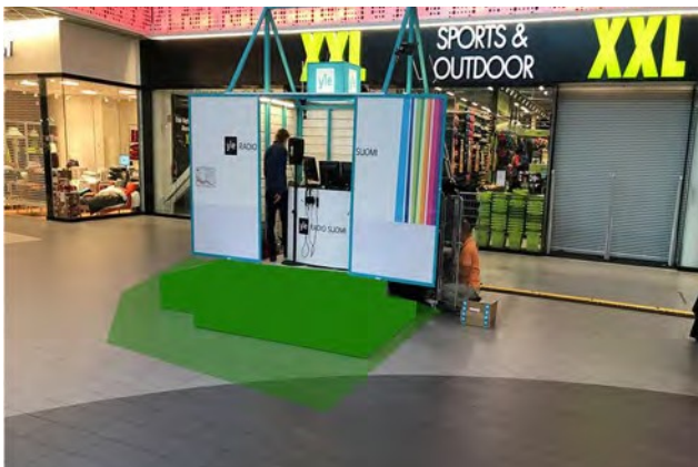
Promo 6. Sepän paja, koko 5 x 3m