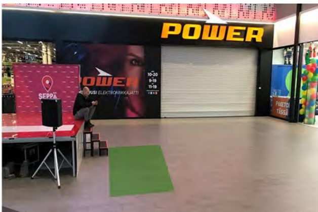
Promo 7. Sepän paja b, koko 5 x 3m