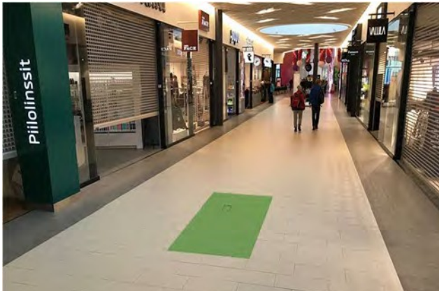
Promo 5. Alasinkuja b, koko 4 x 1,5m